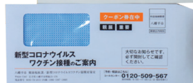
個別郵送される封筒と接種券の見本