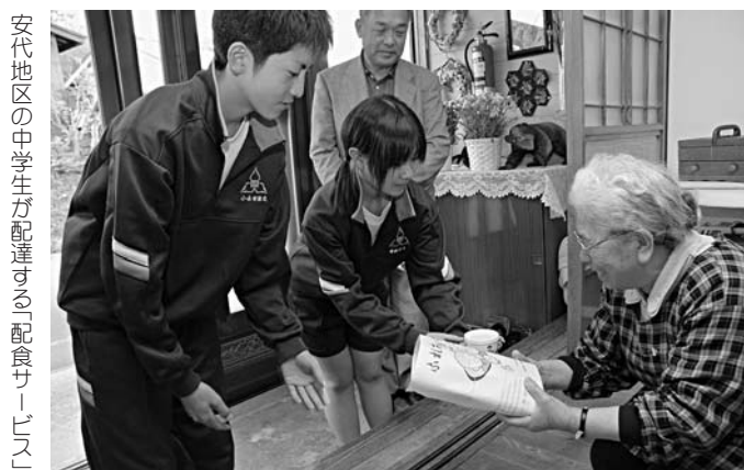
安代地区の中学生が配達する「配食サービス」

答 地区のごみ集積所などでは、市内全域でごみの不法投棄が確認されており、市でも防止施策に苦慮しているところです。モラルの向上や、地域ぐるみでの不法投棄の監視などが必要でないかと考えています。今回提言いただいた、広報紙を通じた啓発活動については、不法投棄の実態を再度調査した上で、実施していきたいと考えています。 (生活福祉部市民課)