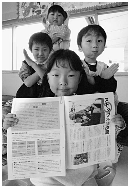
広報はちまんたい8月2日号(No.44)に、不法投棄について掲載しています

※市は、この提言を受けて、市内にある不法投棄について場所や数量を再度確認しました。6月末時点の調査では、市内10カ所以上で発見されました。最近の不法投棄は、産業廃棄物だけでなく、集積所で収集しないごみを捨てる事例が増えています。 市は、不法投棄の実態やごみの捨て方などを周知し、モラルの向上を図るため、広報はちまんたい8月2日号(No.44)で2ページを使い、不法投棄について掲載しました。