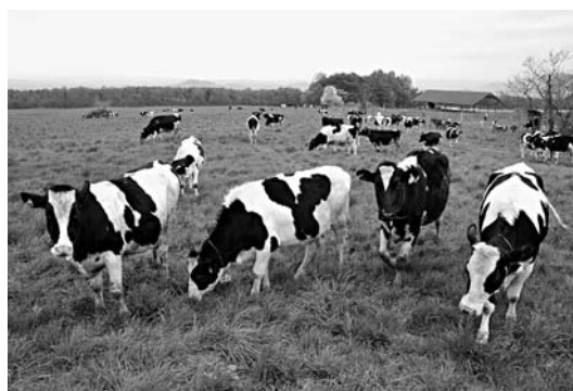
畜産振興に活用されている上坊牧野

数年前、私有地でマウンテンバイクを乗り回す学生を、事故防止のため注意した経緯がある。今、身近に安心して楽しめるマウンテンバイクの無料コースはない。そこで、畜産振興で活用している市営上坊牧野の一部にマウンテンバイクのコースを設け、愛好者が安心して楽しめるようにしてどうか。冬には、スノーモービル場として開放すれば、一年間利用可能なアウトドアスポーツ施設になる。交通の便