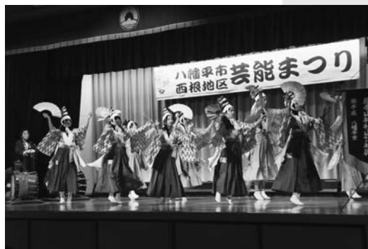
岩手山神社山伏神楽保存会による華やかな神楽

来場者は、ステージ上で繰り広げられる華やかな芸能に見入り、大きな拍手を送っていました。