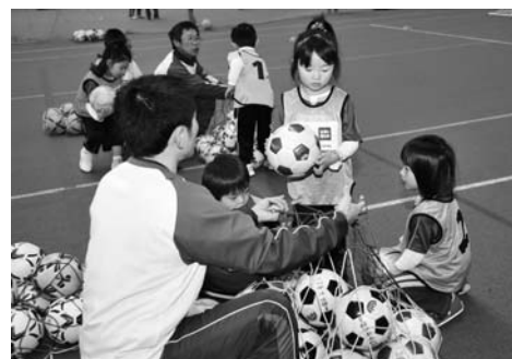
使ったボールは自分たちで片付けます

ルの蹴り方や触り方などの基本について学びました。講習会に引き続き、5人程度で1チームを組み、リーグ戦形式のミニゲームを行いました。子どもたちは、保護者などの声援を受けながら、人工芝のグラウンドでボールを追いかけて、元気いっぱいプレーを見せます。パスやドリブルからシュートが決まると、チームみんなで歓声を上げて大喜びでした。点数や勝敗などは特に記録せず、子どもたちは体を動かすことの楽しさを思う存分体験していました。