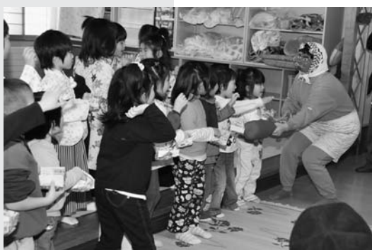
豆まきで鬼に立ち向かう園児たち

柏台保育所の園児23人は1月28日、松尾デイサービスセンターを訪れ、通所者と交流を深めました。