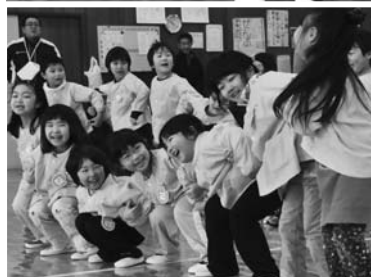
←この日のために練習を重ねてきたお遊戯を、元気いっぱい披露しました