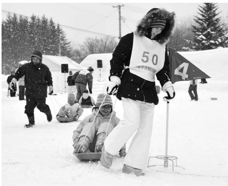
親子で力をあわせた雪上運動会(八幡平温泉郷会場)

岩手山焼走り国際交流村の会場では、バナナボート体験や宝探しに子どもたちが夢中。スノーモービルの試乗や手作り凧の製作指導なども人気を集め、訪れた人たちを楽しませました。