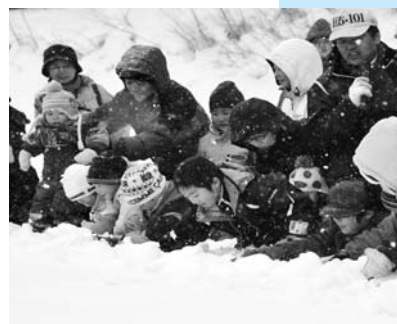
宝探しに夢中の子どもたち(焼走り会場)

八幡平リゾートパノラマスキー場入り口付近の八幡平温泉郷会場では、キャラクターショーや雪像コンテスト、雪上ドッグランドなどが好評。また、七滝観賞雪上トレッキングや樹氷ツアーも人気を集めました。