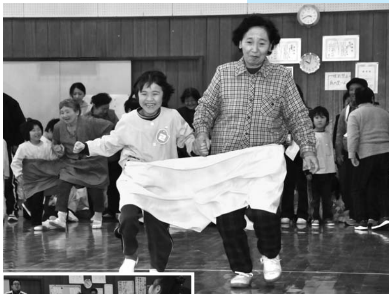
↑お年寄りと手をつないでプレーする「でかパンツリレー」

平成20年度世代交流運動会は2月13日、寺田柔剣道場で行われました。これは、お年寄りと子どもが世代を超えて交流し、住み良い地域にしようとい行われているもので、今年で11回目です。寺田地区の老人クラブ会員や寺田保育所の園児など、約120人の市民が参加。地区ごとに6チームに分かれ、お年寄りや園児たちは力を合