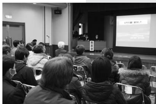
さまざまな取り組みが発表されました

市の教育振興に関わる人が一堂に会し、今後の運動について共通理解を深めようと、平成20年度八幡平市教育振興運動推進大会は2月21日、市総合福祉センターで開かれました。