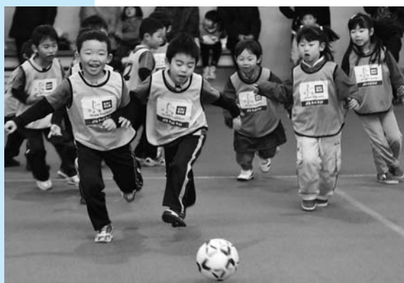
楽しくサッカーに親しむ子どもたち

市内外の公認キッズリーダー資格者10人が講師となり、講習会が始まります。笑顔で駆け回り、体を温めた後、ボー